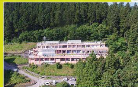
【撮影場所】東京多摩学園 【撮影者】利用者44名・施設職員 【映像演出・台本】野崎美子・河田園子 【映像編集】メディアパーティ株式会社