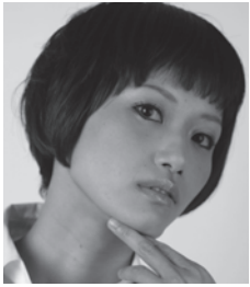
サリngROCK ＜大阪府＞ 突劇金魚

劇作家・演出家・俳優。 突劇金魚主宰。 2002年に劇団を旗揚げし、大阪を拠点に活動している。 2008年に第15回OMS戯曲賞大賞、2009年に第9回AAF戯曲賞優秀賞を受賞。 2011年には、自作の戯曲「しまうまの毛」を小説化し出版するなど、執筆活動もしている。